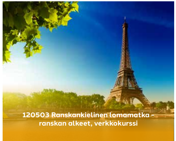
120503 Ranskankielinen lomamatka - ranskan alkeet, verkkokurssi