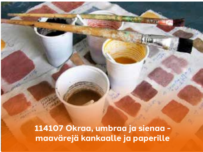
114107 Okraa, umbraa ja sienaa - maavärejä kankaalle ja paperille