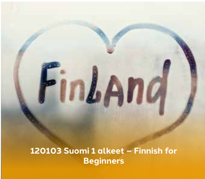
120103 Suomi 1 alkeet – Finnish for Beginners