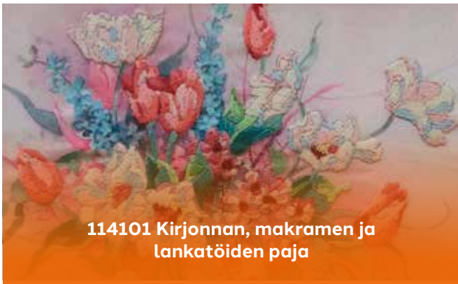
114101 Kirjonnän, makramen ja lankatöiden paja