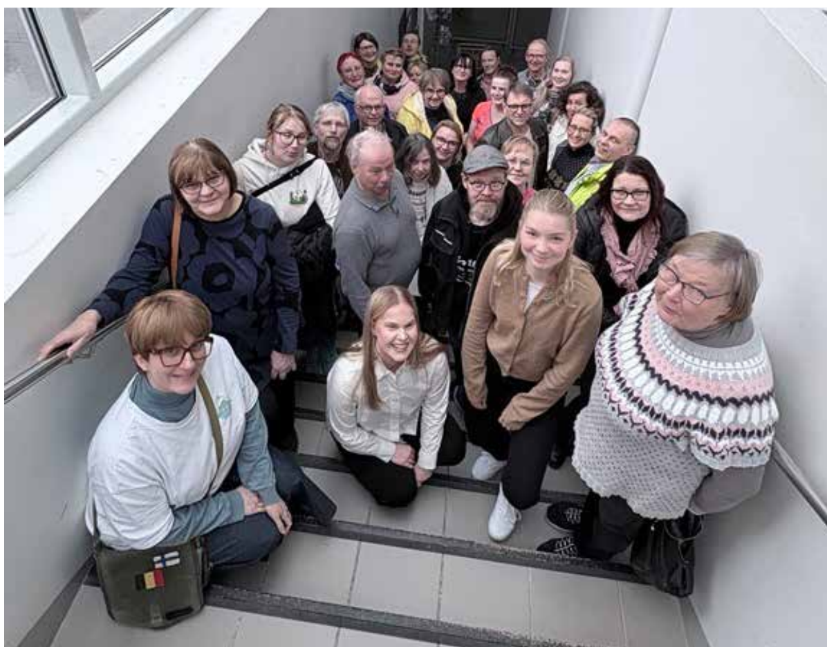
Tunti-, suunnittelijaopettajat ja henkiökunta 28.4.2026