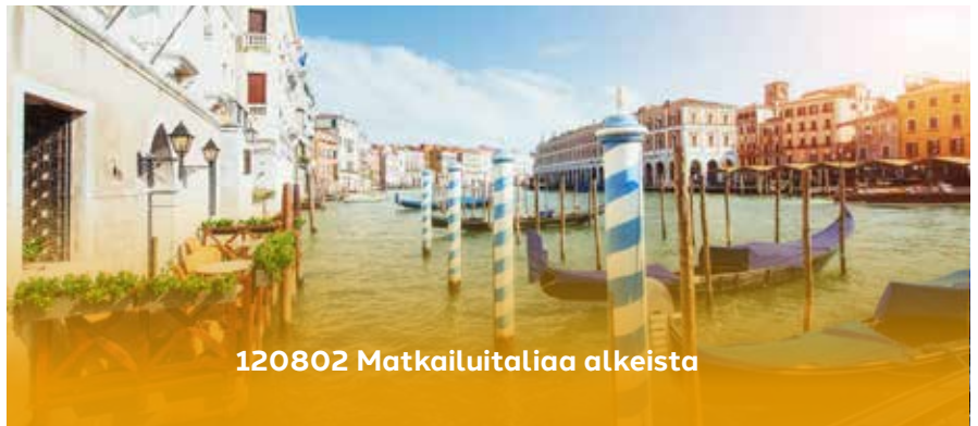
120802 Matkailuitaliaa alkeista

Sukellus Italian kulttuuriin! Kieltä ja kulttuuria käsikkäin. Vahvistetaan italian taitoja eri aiheista keskustelemalla, lukemalla ja kuuntelemalla rennossa ilmapiirissä. Materiaalina Italiano per passione kpl 4. Taso B1. Voit osallistua myös etänä.