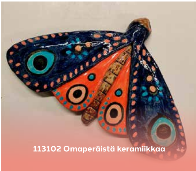
113102 Omaperäistä keramiikkaa