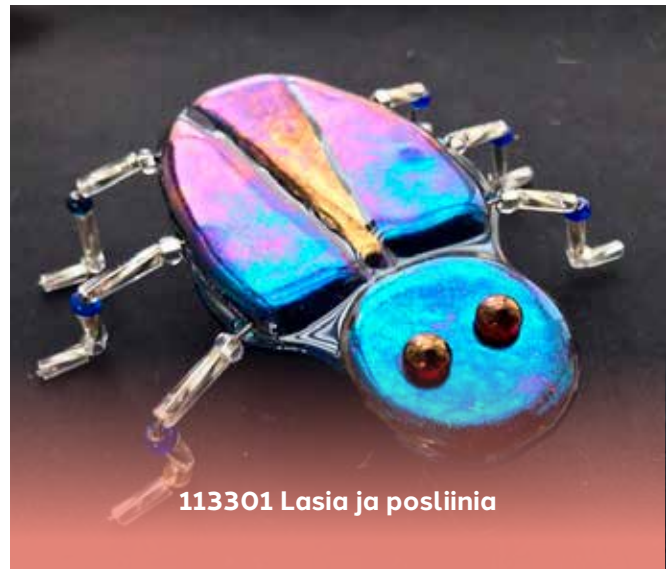
113301 Lasia ja posliinia