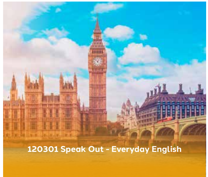
120301 Speak Out - Everyday English