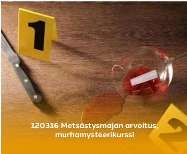
120316 Metsästysmajan arvoitus, murhamysteri kurssi