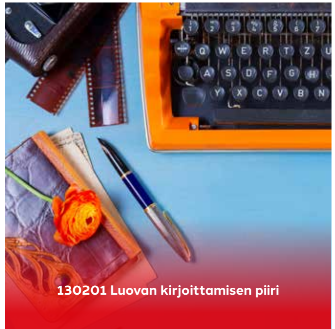
130201 Luovan kirjoittamisen piiri