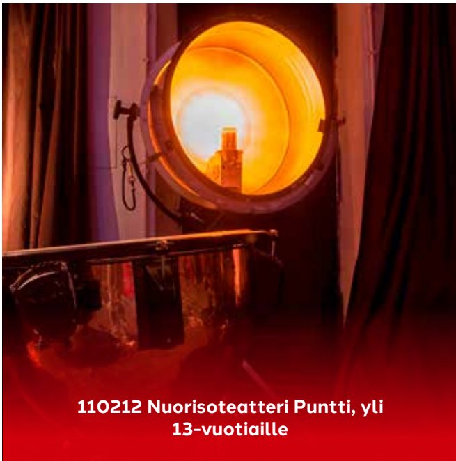
110212 Nuorisoteatteri Puntti, yli 13-vuotiaille